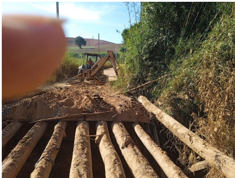
Imagem 1: antes da execução

Segue anexo, exemplo de como é utilizado esses materiais, abaixo é um exemplo na ponte Mococa.