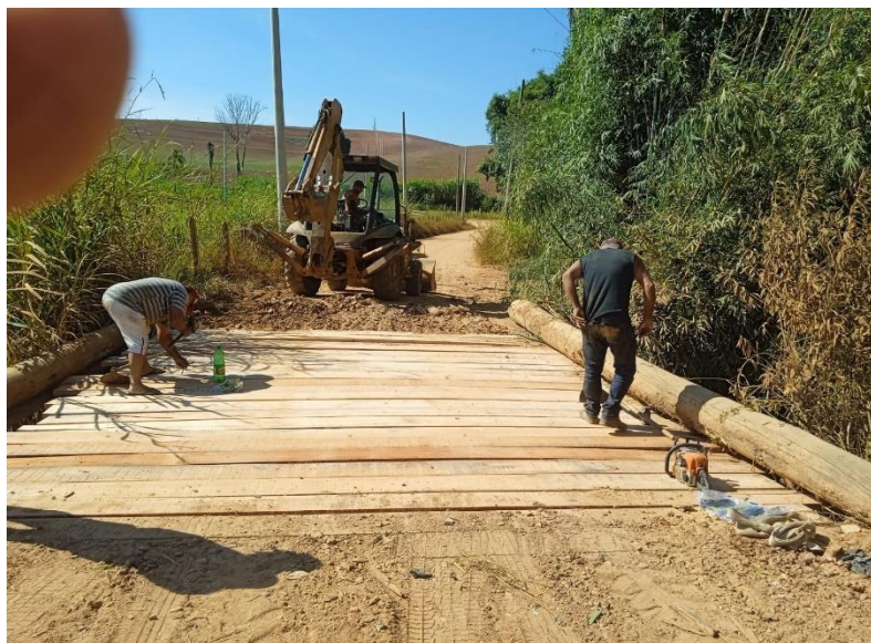
Imagem 3: Finalização