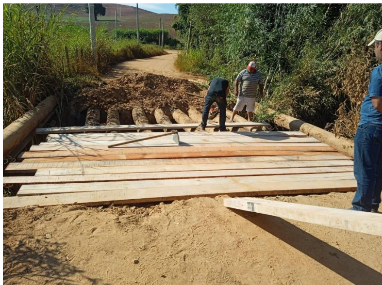
Imagem 2: Durante a execução