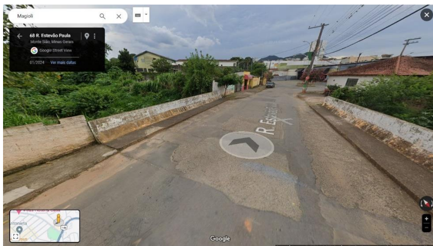
R.Estevão Paula, n° 68

Segue em anexo alguns modelos que temos de pontes de concreto pela cidade.