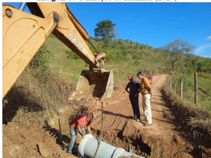
Imagem 06 Utilização de manilhas (2024)