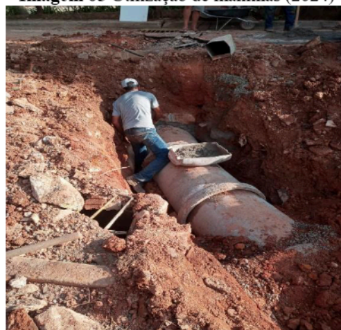
Imagem 05 Utilização de manilhas (2024)