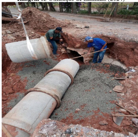
Imagem 03 Utilização de manilhas (2024)