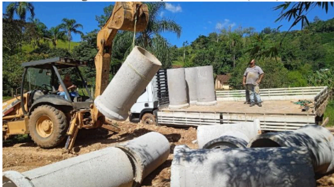
Imagem 08 Utilização de manilhas (2024)

Rua Mauricio Zucato, 111 – Centro, Monte Siao/MG. CEP 37580-000 Telefone (35) 3465-4600 – email: nucleocompras@montesiao.mg.gov.br