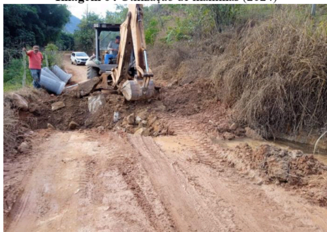
Imagem 04 Utilização de manilhas (2024)