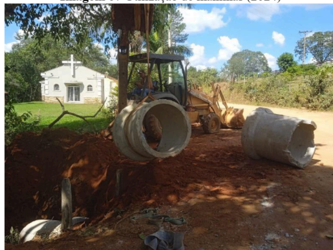
Imagem 07 Utilização de manilhas (2024)