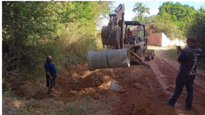
Imagem 09 Utilização de manilhas (2024)